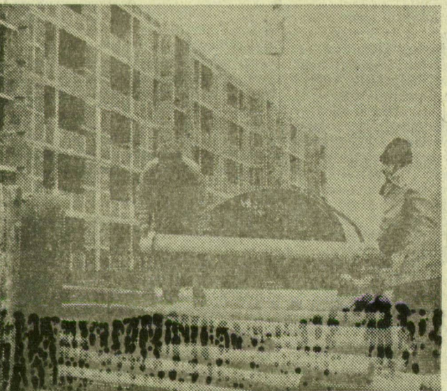
A négyemeletes házakban télen is dolgoznak. Előreépítik a lakóházakat