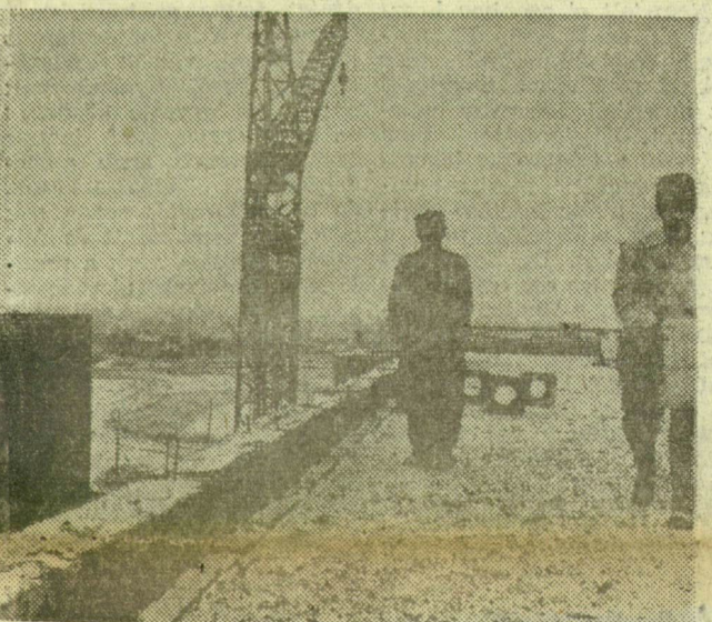
A 111-es jelű épület tetején elővégáztatják a kéményeket. Ezt a munkát nem zavarja a kemény tél sem