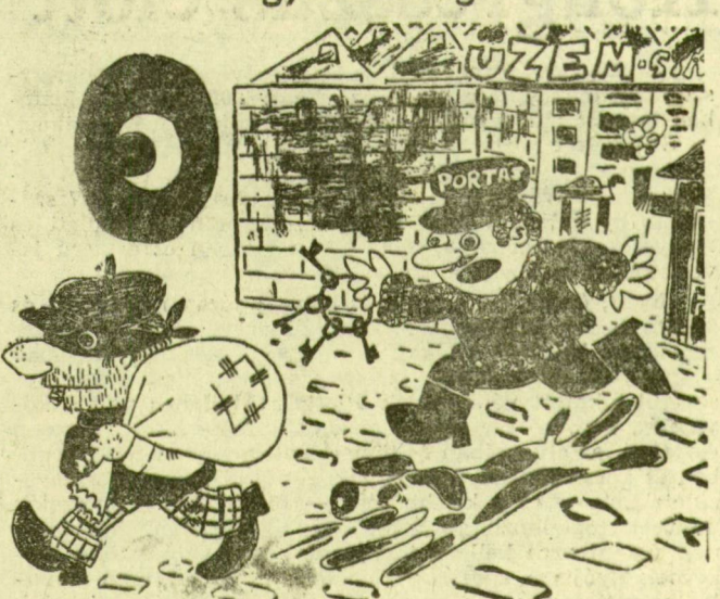
Zsoldos Sándor rajza Alljon meg ember, itt felejtette a lakáskulcsát!