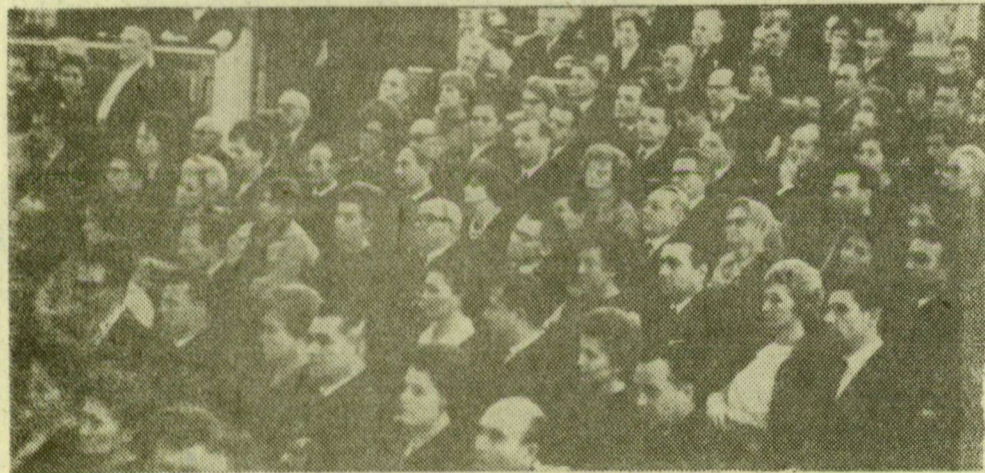
A díszünnepség résztvevőinek egy csoportja