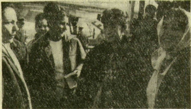
A Magyarországon sorra kerülő üzbég kulturális napokra Uzbecsziánból kulturális küldöttség érkezett Magyarországra. A képen: a küldöttség tagjainak fogadása a Ferihegyi repülőtéren