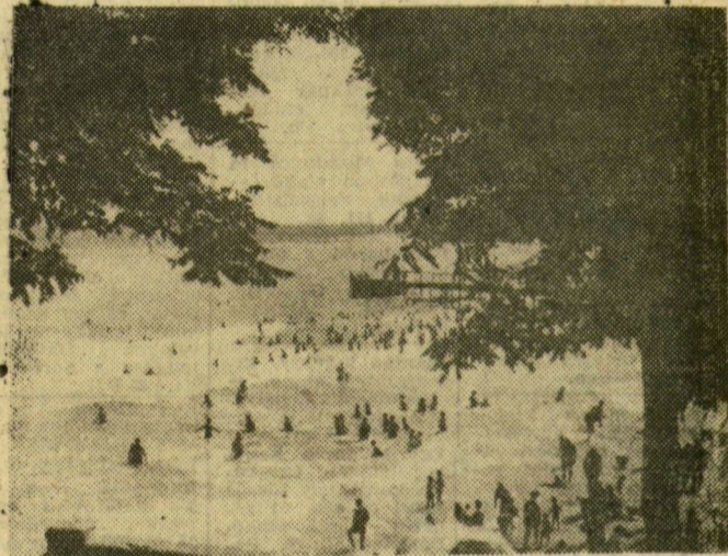
Odessza a fürdőhelyek, üdülők, szanatóriumok sokaságáról is híres. Turistaforgalma egyre nő. Tengeri strandjai festőiek — mint a képen látható Arkadia-strand is