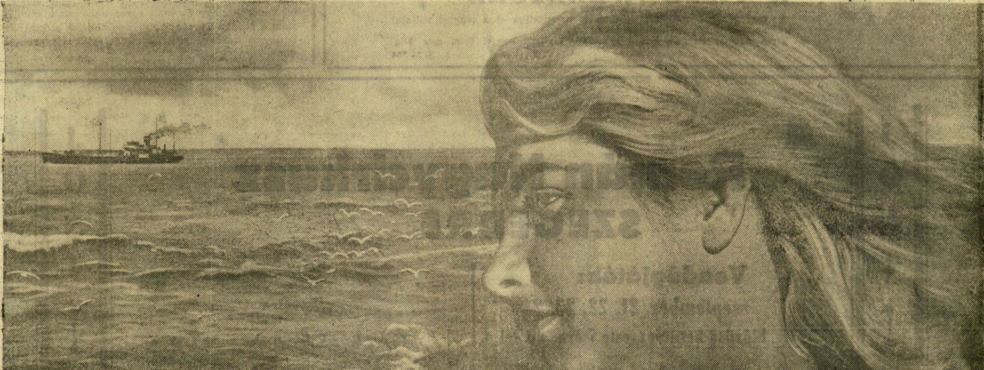
Hosszú útra indul a hajó és a tengerész. Anyak, feleségek, gyerekek, vagy a kedves búcsúztatja és várja őket...

Minden évben szebb lesz a Fekete-tenger partjának gyöngyszeme, egyre termékenyebb az odesszai terület földjei. Munkásai büszkén tekintenek vissza a kommunista párt vezetésével megtett útra, és arra törekednek, hogy a jubileumi évben új sikerekkel örvendeztessék meg hazájukat.