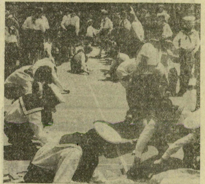
A rajzverseny részvevőinek egy csoportja