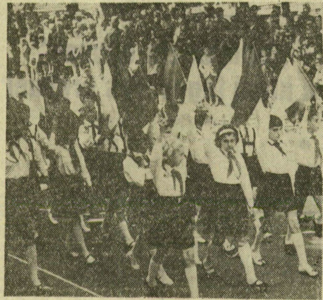
Magasba emelt zászlókkal