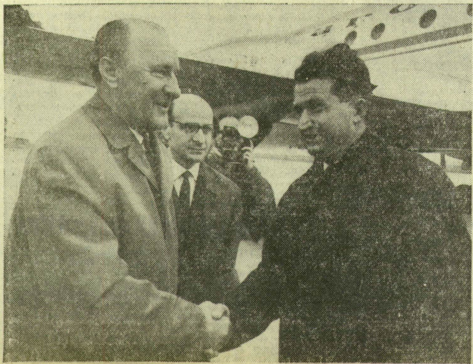
A Ferihegyi repülőtéren Kádár János elvtárs fogadta Nicolae Ceausescu elvtársat

A delegációt Nicolae Ceausescu vezeti — Megkezdődtek a pártküldöttségek tárgyalásai