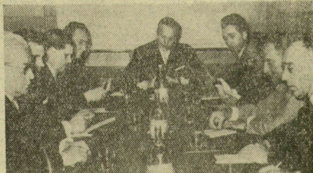
Péter János külügyminiszter Marko Nikezics külügyminiszterrel tárgyal. Balról a magyar, jobbról a jugoszláv küldöttség

Kedden folytatódott a magyar-jugoszláv hivatalos tanácskozások. Míg a hétfői megbeszélések központjában az európai helyzet időszerű kérdései, köztük az európai biztonság megszilárdítása és a német kérdés szerepelt, Péter János és Marko Nikezics ezúttal a nemzetközi helyzet más időszerű problémáiról, köztük a vietnami kérdésről, majd a két baráti szocialista ország kapcsolatairól folytatott véleménycsere-t. A tanácskozáson a két külügyminiszter megelégedéssel állapította meg, hogy Jugoszlávia és Magyarország kapcsolatai az élet minden területén kedvezően alakulnak, s állást foglalt a két ország viszonyának a jószomszedság és a szocializ-