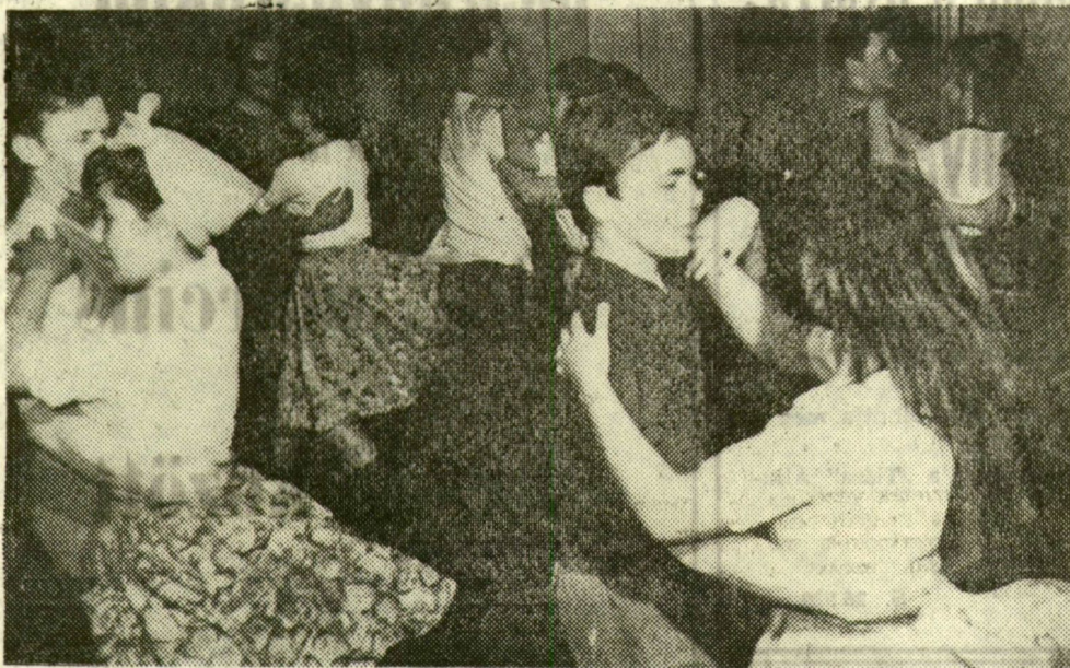
A Juhász Gyula Művelődési Otthonban vidáman ropják a táncot a népi táncosok. Új műsorukra készülnek, s ez bizony a szórakozás mellett alapos munka is. A veritékes próba után viszont jólesik a beszélgetés, a tréfa.