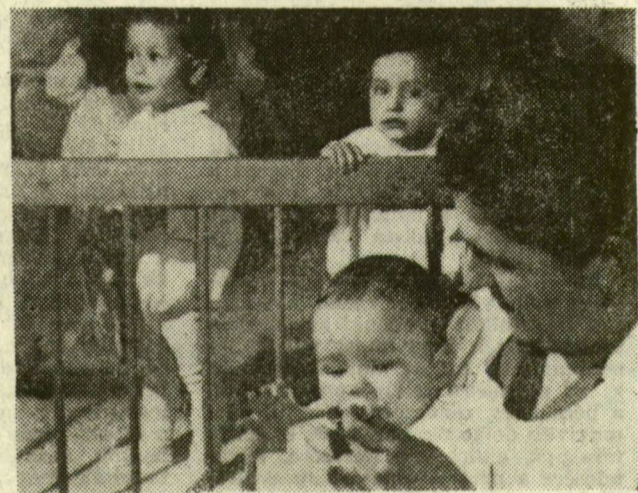
Dolgozó anyák gyermekei a napköziben

Azt szokták mondani, hogy az egészség mindennél fontosabb. A város vezetősége készüléssel zsebbe nyúl a gyógyítás továbbfejlesztéséért, illetve a betegségek megelőzése érdekében. A költségek 14 millió forintot emésztettek fel, de soha rosszabb helyre ne adjunk ki ennyi pénzt! Öt év alatt tíz új gyermekszakorvos áll munkába; felújították az újszegedi gyermekkorházat; meg-