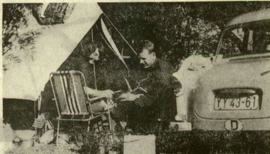
Német turisták az újszegedi kempingben