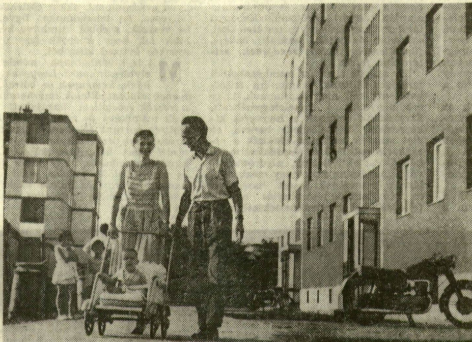
Családi séta az új lakótelepen