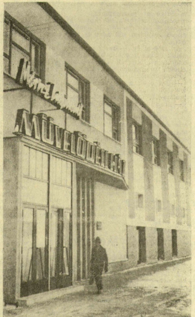
A mihályteleki művelődési otthon

Még sok-sok számot, adatot lehetne felsorolni Szeged szellemi életének gyarapodásáról. A fentiek is meggyőzően bizonyítják azonban, hogy népi államunk olyan beruházásokra adott pénzt a közvagyonból, amelyek elősegítik a tudomány és az általános művelődés további fejlődését.