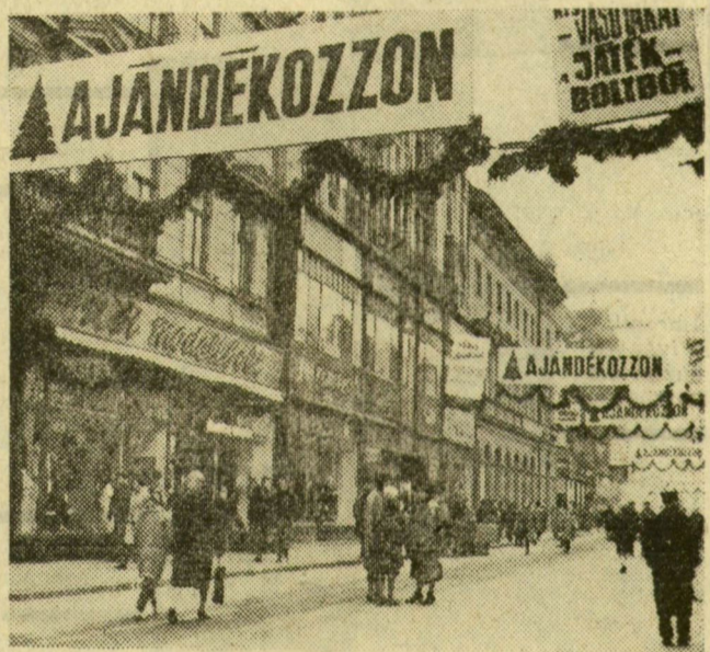
Reklámdíszben a Kárász utca

Ajándékozás lázában ég most mindenki, így ünnep előtti időben, s a vásárlókat, kirakat-böngészőket még külön is buzdítják a fénygally-díszes reklámtáblák a Kárász utcán végig. A kirakatok is ünnepies díszben pompáznak, s felnőttek — gyerekek bőséges választékot kínálnak.