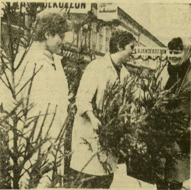
Fenyőfávasár a 31-es áruda előtt