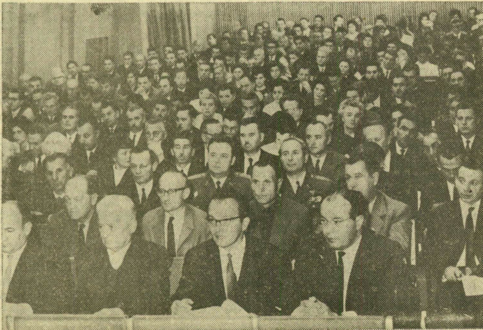
A PÁRTÉRTEKEZLET ELNÖKSÉGE ÉS A KÜLDÖTTKÉK