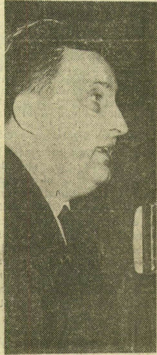
A városi pártbizottság első titkára szóbeli kiegészítést terjeszt elő a beszámolóhoz

(A városi pártbizottság beszámolóját a 2-3-4. oldalon kivonatolva ismertettük; a vitát az 5-7. oldalon foglalkozunk össze.)