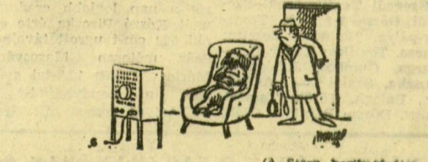
(A Stern karikatúrája)

Zambiai nők a miniszoknya ellen. Zambiában az uralmon levő Egyesült Nemzeti Függetlenségi Párt női tagjai háborút indítottak a miniszoknya ellen, amelyet egyik képviselőnjük „az erkölcsstelséghez vezető létrának” nevezett. A felháborodott női politikusok felszólították a kormányt, hozzon törvényes intézkedést az efféle divathóbortok ellen.