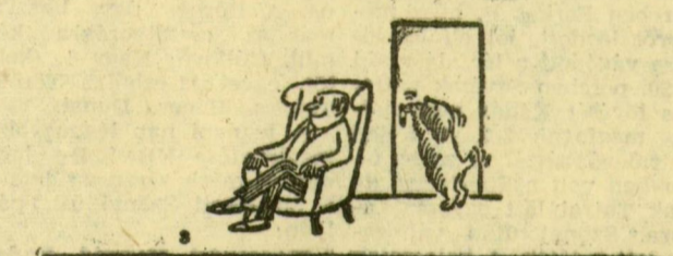
(A Stern karikatúrája)