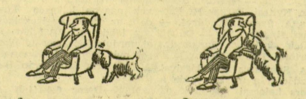
(A Stern karikatúrája)