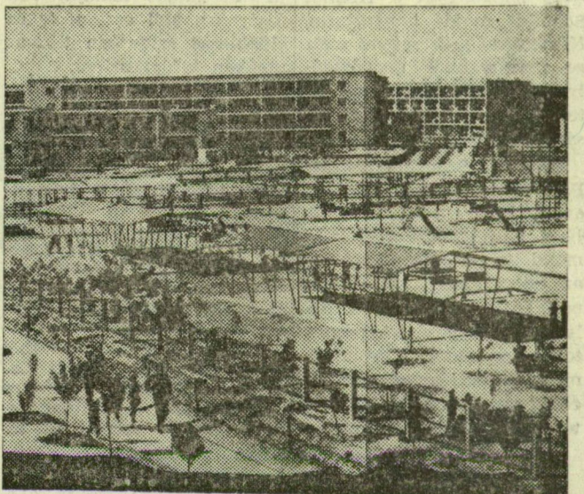
Iparváros a pusztán

A Varsói Szerződés tagállamainak honvédelmi miniszterei is megsejmeltek és ellenőrizték a Vltava hadgyakorlatot. Balról Malinovszkij marsall, balról a harmadik Csinzse Lajos, mellette balról jobbra: Lomszkij, Hoffmann és Grecsko marsall.