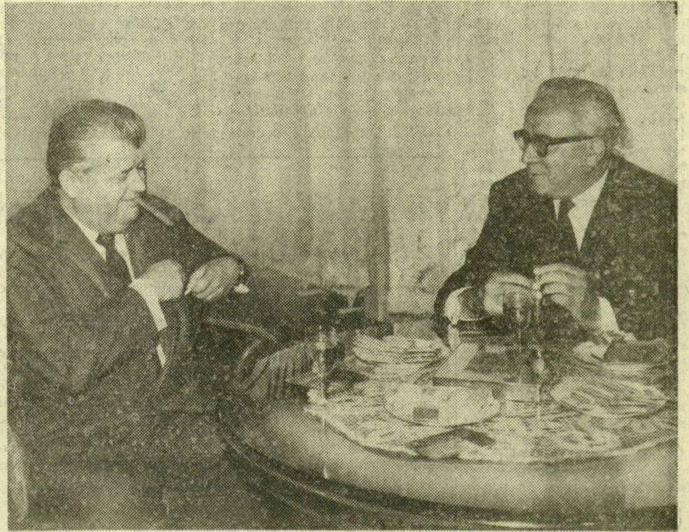
A hivatalos látogatásra hazánkban tartózkodó Per Haekkerup dán külügyminiszter szerdán felkereste hivatalában Péter János magyar külügyminisztert. Képfunkció: barátságos eszmecsere folytat a két külügyminiszter

Városnézés — A dán külügyminiszter fogadása