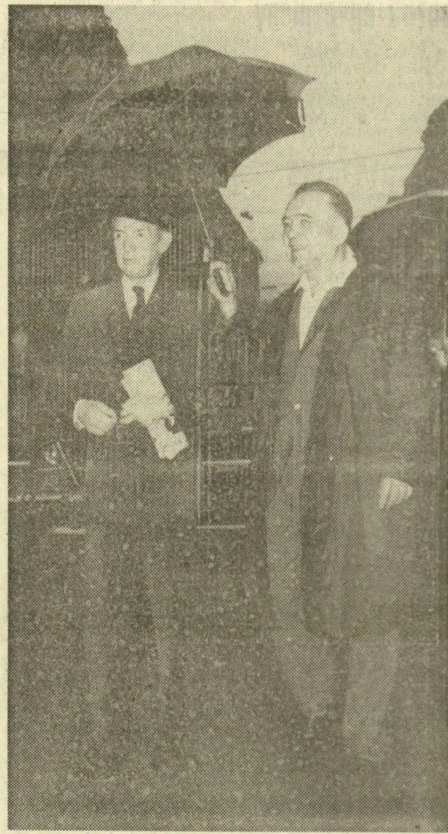
A hazánkban tartózkodó francia külügyminiszter a Balatonhoz utazott pénteken reggel. Az indulásnál az esernyő is fontos szerepet kapott: a kiadós nyári eső ellenére vendégünk jókedélyűen vágott neki a magyar tengerhez vezető útnak

Az európai biztonság, a német probléma, a vietnami kérdés, akárcsak Prágában, Budapesten is a megbeszélések központjában állottak — húzzák alá a francia lapok,