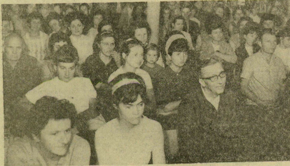
A ruhagyári barátsági gyűlés résztvevőinek egy csoportja