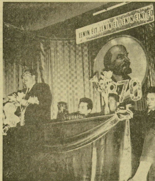
Az ünnepség elnöksége

Az MSZMP Szeged városi bizottsága Vladimir Iljics Lenin születésének 96. évfordulójára alkalomból csütörtökön délután emlékünnepeket rendezett a DAV szegedi igazgatóságának Klauzál téri művelődési termében.