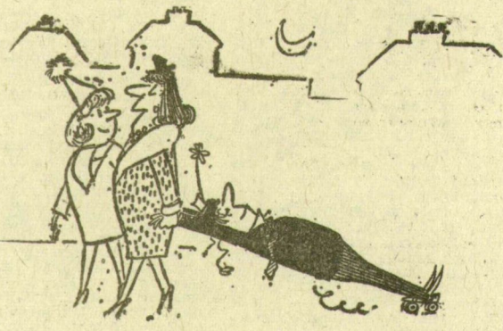
(A Quiek karikatúrája)