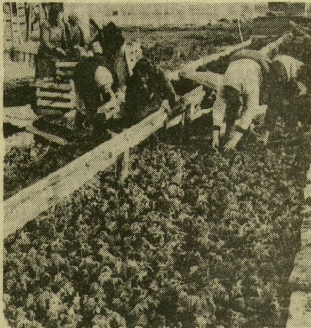
Készülnek az újabb melegágyak a tápéi Tiszatáj Tsz.-ben

Szőregeen már vetnek — Nehéz helyzetben a szegedi tsz-ek — Kertészkedés Tápén