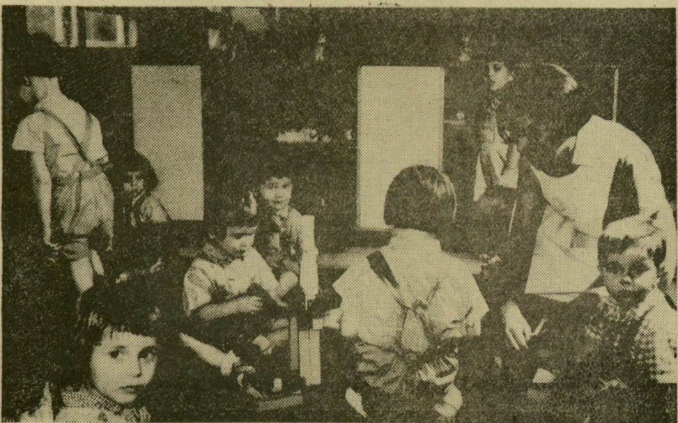
A háromévesek játszótérjében