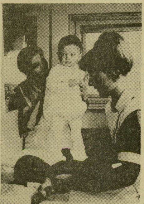
Ültőtetés, séta előtt