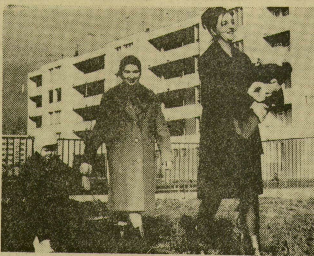
Úton a bölcsődébe