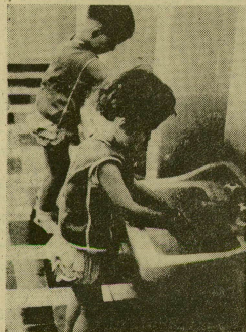
Ebéd előtt kézművés!