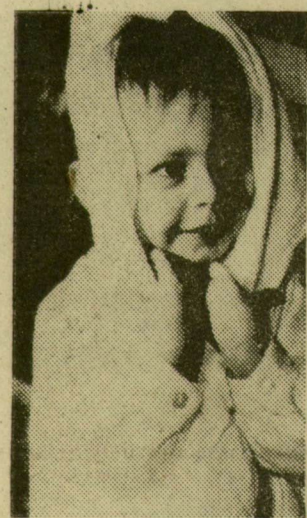
Kis Hildikó mindig jókedvű