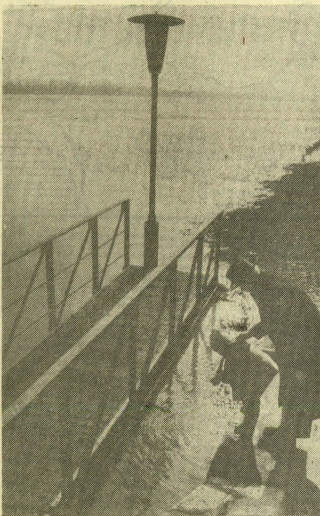
A nagyapa és unokája a Tisza partján „vízszint”-ellenőrzésen Szegednél

A fő erőfeszítés továbbra is a Veker-Korog-Ludas-ér fűcsatornánál van és a Kurca torkolatánál. Szentés és Mindszent térségében tovább növelték a szivattyútelepek teljesítményét ideiglenes szivattyúk beépítésével. Szentésnél több mint 50 százalékkal emelték meg a szivattyúk kapacitását. A Kurca alsó torkolatánál, Mindszentnél pedig háromszorosra növelik a teljesítményt a vizek elvezetésében. Általában mindenütt erősen csökkenő tendenciát mutatnak a belvizek s ehhez hozzájárul a jelenlegi kedvező időjárás is. Ha közben nem lesz csapadék, akkor a még hátralevő belvizekkel viszonylag gyorsan megbirkóznak. Jellemző a munkák ütemére, hogy az utolsó 24 órában a belvizeknél dolgozók létszámát mintegy 300-zal növelték. Részt vett a munkában 25 gépkocsi, 11 vontató, három földtoló, 8 erógép, 5 kotró, 1 dömpér és számos fogat.