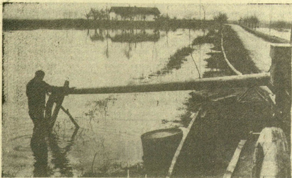
Deszk határán is szivattyúk segítik a földek víztelenítését

Az Alsó-tiszavidéki Vízügyi Igazgatóság tegnapi jelentése szerint Csongrád megyében az előtött vetésterületek kétharmadáról levezették már a belvizet s az előtött szántókról is felére csökkentették az előtést. Utoljára a rétek és legelők lecsapolása marad, noha ezeknek 25 százalékáról is elvezették már a vizet.