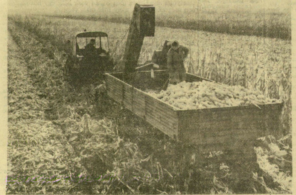
Munkában a KCSF csőtörő-fosztó kétmenetes kukoricabetakarító gép. Napi teljesítménye 2-3 hold