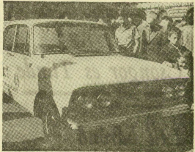
Az új típusú Moszkvic

A guruló autókiállítás ma délig marad Szegeden, majd a karaván Belgrádba indul.