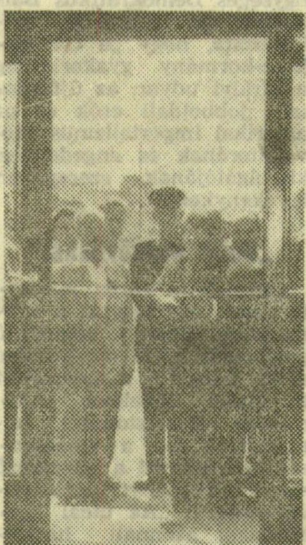
Az ünnepélyes átadás

lis létesítmények is hiányoztak. Ez tette szükségessé, hogy másfélmillió forint értékű beruházással ezen a vasútállomáson is új pályaudvari kirendeltséget hozzanak létre. A jobb szociális ellátottságra annál is inkább szükség volt, mert a szegedi Tisza pályaudvaron az AKÖV százötven dolgozója évente a mintegy 21 ezer vasúti kocsiút ki, illetve meg, ami azt jelenti, hogy évente általában 500 ezer tonna súlyt mozgatnak meg a munkások.