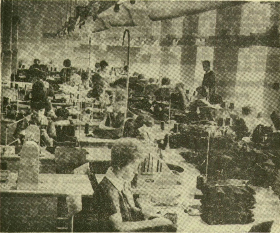
A korszerű, új munkaterem

Megszoktuk már, hogy a Szegedi Ruhagyárban minden esztendő hoz valami műszaki munkaszervezési újdonságot. Mióta a gyár egyes ruházati cikkek, elsősorban a munkaruha- és iskolaköpeny-gyártásban profilgazda lett, mind több időt tudnak fordítani a termelés, a technológia tökéletesítésére. Január elején azzal a feltétellel vették át az iskolaköpenyek gyártását a Soproni Ruhagyártól, hogy három százalékkal növelik a termelési sebességet. Ez komoly teljesítménynek számít, hiszen az elmúlt tíz évben elég magas szintre emelkedett az iskolaköpenyek gyártásának termelékenysége a soproni üzemben.