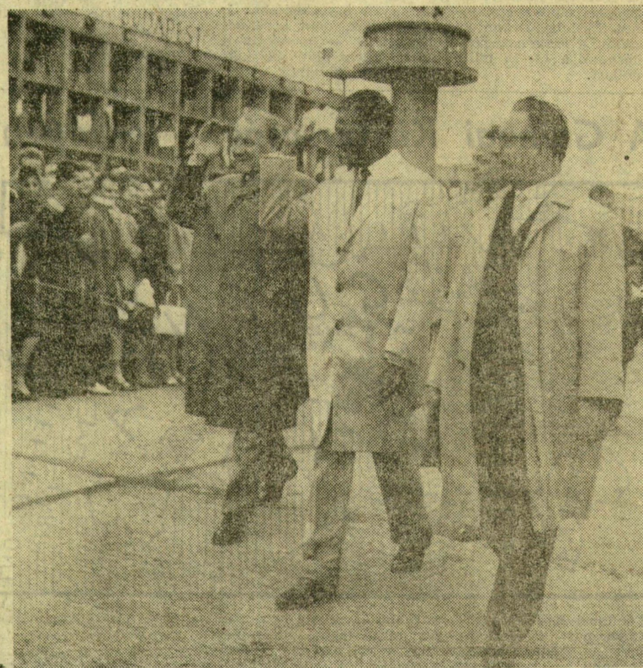
BÚCSÚZÁS A REPÜLŐTÉREN

A magyar és a guineai himnusz hangjai után Sekou Touré — Kállai Gyula és Kisházi Odön társaságában — ellépett a tiszteletére felsorakozott díszegység soraiba, majd az afrikai vendégek elkészültek a búcsúztatásukra megjelentektől. Úttörők virággal kedveskedtek a hazánkból távozó guineai párt- és kormányküldöttség vezetőjének