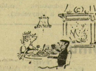
— Alom és valóság

— Zeneművész-jelöltek. A felvételi vizsgák eredményeinek értékelése után a Zeneművészeti Főiskolán döntöttek az új zeneművész-jelöltek személyéről: 250 jelentkező közül választották ki a legtehetségesebbeket. Ötvenkét fiatal folytathatja tanulmányait a zongora, hegedű, kürt, trombita, gordonka, illetve középis-kolai énektanár és karvezető-képző tanszako-kon. Az ide-n is felvettek két különlegesen tehetséges fiatal, akik középiskolás tanulmányaikkal egyidőben járhatnak a főiskola zongora-, illetve hegedű-tanszakra.