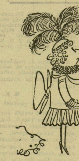
— Ne csodálkozzék, legalább mindig tudom, hol a férjem