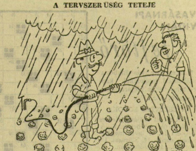
— Minek locsol, hisz esik az eső? — Mára van beütemezve.

■ BALESETI UTÓKEZE-LESEK, reumas megbetegede-ések, gyomor- és bélbántalmak gyógyításában fürdő-és ivókúrák formájában eredményes a Vas megyei büki forrás vizet, amelyet az egészségügyi miniszter hivatalosan gyógyvízzé nyilvánított. A fürdőt tavaly 110 ezren keresték fel.