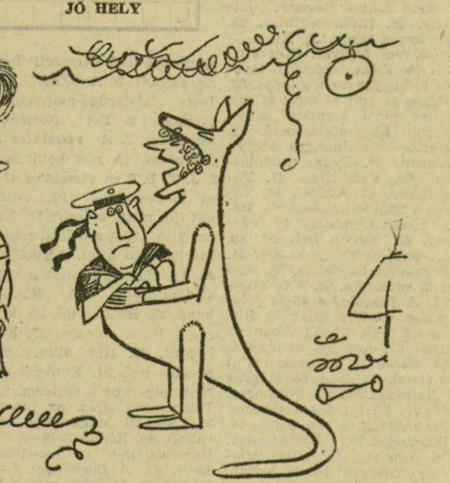
— Ne csodálkozzék, legalább mindig tudom, hol a férjem