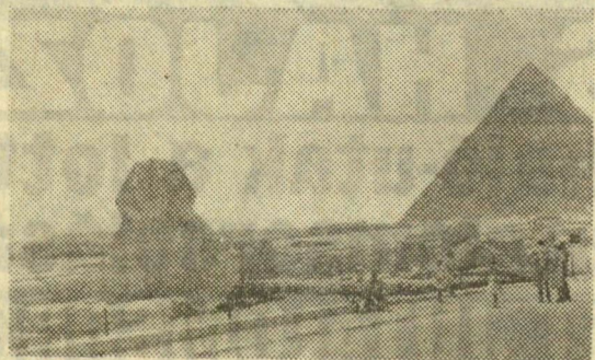
A Kefren piramis és a nagy Szfinksz

Ma közel négymillió lakosa van Kairónak, s a Nílus-parti hatalmas városban modern európai negyedek és középkori jellegűek maig is sértetlenül őrző, túlzásfolt, bűzös, nyomorúságos arab utcák váltogatják egymást. Az európai városrészek csak a múlt század végén, Iszmail kedive idejében kezdett épülni. A kedive ingyen adott telket annak, aki legalább 15 000 frankot érő ház építésére kötelezte magát. Az angol megszállás éveiben sem takarékoskodtak a