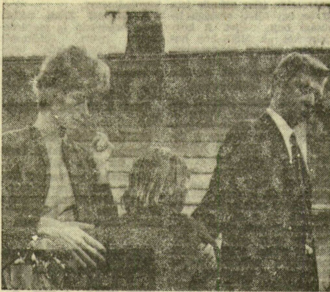
Az első férj elviszi a kislányt. Jelenet a filmből

A film becsületesen és racionálisan, a valóságról soha egy pillanatra sem megfeledkezve beszél a témáról. (Ez nincs ellentétben azzal, hogy a feldolgozás időnként érzelmes színezetet kap.) A racionális alapállás arra vonatkozik, hogy a film nem épít légvárakat, nem lesz hamis illúziók rabja és közvetítője. Ellenkezőleg, végig és következetesen a probléma ne-