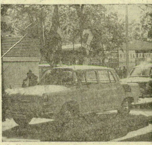
Az új 1000-MB típusú Skoda gépkocsi a csehszlovák pavilon előtt.