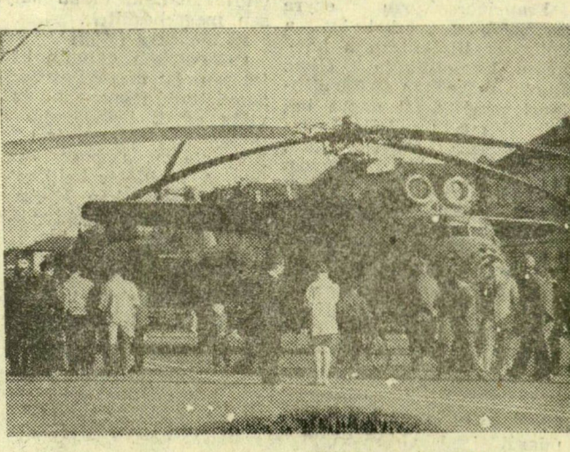
A Mi-6-os szovjet óriás helikopter, melyet a Dózsa György úton mutatnak be, ahonnan a táborúfökre indul.