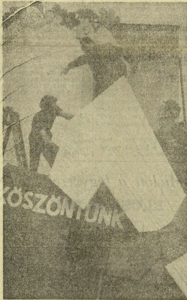
Képeinken: a textilművek dekorációs brigádja hatalmas transzparenst készíti a gyár díszítésére (fent) — a Móra Ferenc Iparitanuló Intézet növendékei szép táblákat készítenek a felvonuláshoz (alsó kép).

Tegnap ellátogattunk Újszegedre is, hogy körülnézzünk a ligetben. Száznyolcvan négyzetméteren emelnek sátrakat a kereskedelmi és vendéglátó vállalatok — szemben a tavalyi százharminchat négyzetméterrel —, hogy minél zavartalanabb legyen a majálison a kiszolgálás. Az élelmiszer-kiskereskedelmi vállalat három, a földművelésszövetkezetek három, a Csongrád Megyei Vendégtatóipari Vállalat nyolc, a Hungaria egy pavilont állít. Játékokat és emléktárgyakat négy pavilonban árúsítanak. Az ünnepre megnyitják a Roosvelt téri Birka-csárdát is.