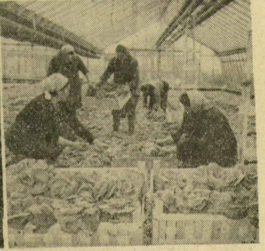
Az üvegház ontja a primórt