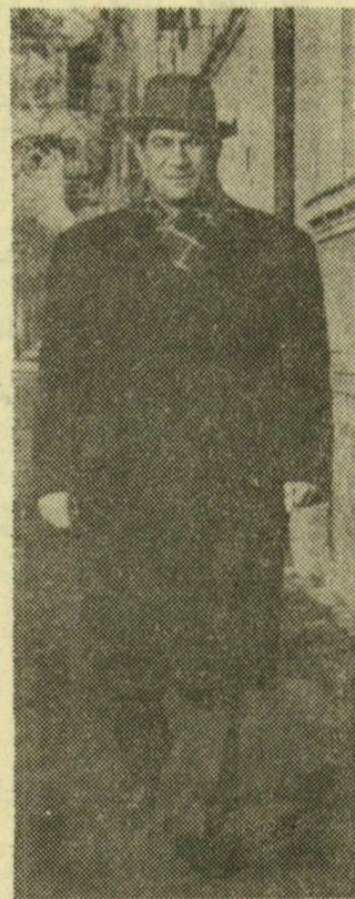
Frissen, fiatalosan — újból itthon...

Mint mindegyik keleti és ázsiai országban, a kereskedelem ott is erősen virágzik. A nagy áruházak mellett ezerszámra található a kis bazárakban és sátrakban áruló tömege. Nagyon sze-