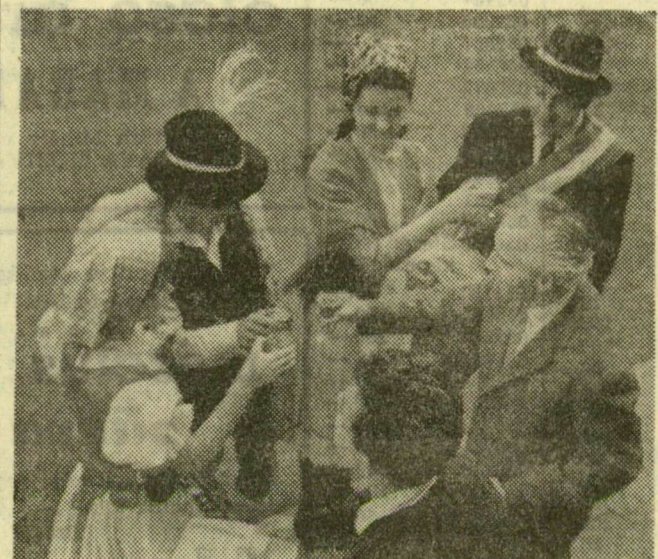
A hagyományoknak megfelelően aszúval koccintanak a tarcali szüreti ünnepeken

megye a szocialista ipar fellegváraként él. Ez igaz, de központja, Miskolc immár abban az értelemben is „ipari fellegvár”, hogy több mint tíz esztendeje kitűnően felkészült bányá-, kohó- és gépészmérnököket képez az országnak.