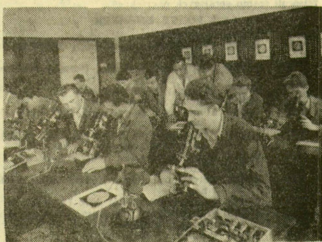
Szorgalmasan gyakorolnak a hallgatók a Miskolci Nehézipari Műszaki Egyetem ásvány- és kőzettani tanszékén

Mindkét helyen, Barcikán és Szederkényben élő, termelő üzemek fogadják a látogatót, de korántsem befejezett alkotások. Még több