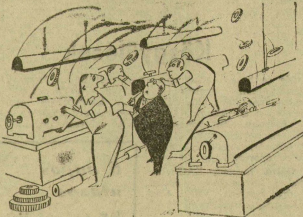
(Erdei Sándor rajza.)

— Micsoda lendület! — Ugyan, Negyedévi prémium.