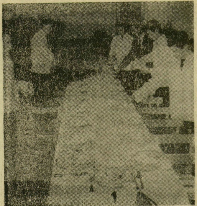
Pincériskola Az izléses terítést és az udvarias felszolgálatot három év alatt tanulják meg az ifjú pincérek a szegedi Hági Étteremben. Képeinken egy szépen díszített lakodalmi asztalt terítének a pincérjelöltek