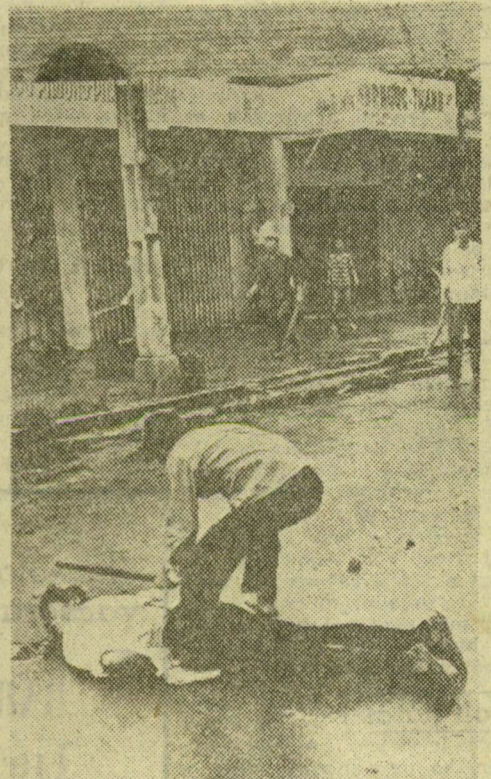
Szinte naponta újabb meg újabb utcai csetepatékban embereket vernek agyon. A félrevezetett, egymásra uszított fiatalok, buddhisták és katolikusok leirhatatlan dühvel irtják egymást.