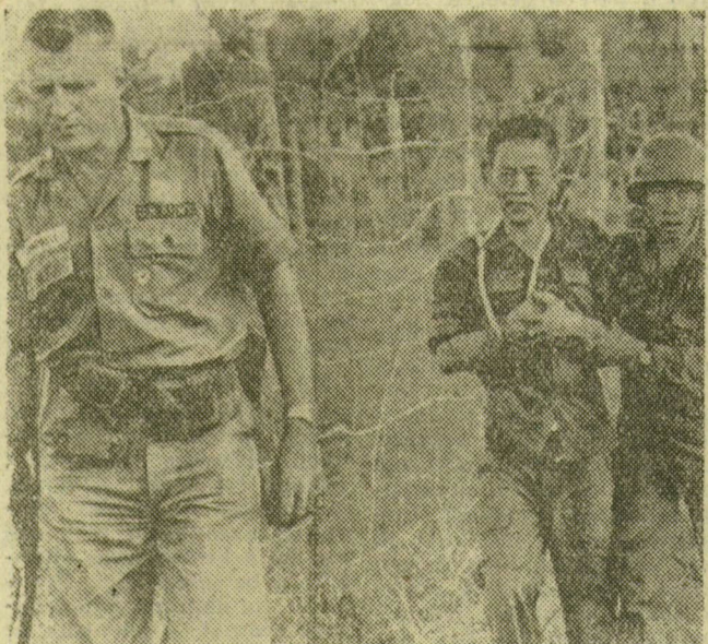
Az US ARMY egyik katonája látható a drótsövények mögött, a dzsungelháború egy megláncolt kezű sebesültjével. Kihallgatásra viszik az elfogott szabadságharcost, aki igazi szabadságot akar hazájának.

A nyugat-berlini Tagesspiegel kerekben megírta, hogy Csombe, Afrika első számú bajkeverője „fehér zsoldosok nélkül azonnal összeomlana”. E lap szerint Csombe havi 400 dollárt és veszélyességi pótlékot fizet a hivatásos bérgyilkosoknak — a teljes ellátáson felül. Más források havi 1200 dollárról szólnak. Csombe főképpen Hitler egykori SS-legényeit sorozza be szoldosai közé. De szívesen fizet bármilyen nemzetiségű kalandornak, ha az gátlástalanul öl. Csombe fehér zsoldosai más-más nyelven beszélnek, de a gyilkolás óráiban igen jól megértik egymást. Egyazon fasiszta lélek lakozik bennük, ha egyáltalán van lelkiük.