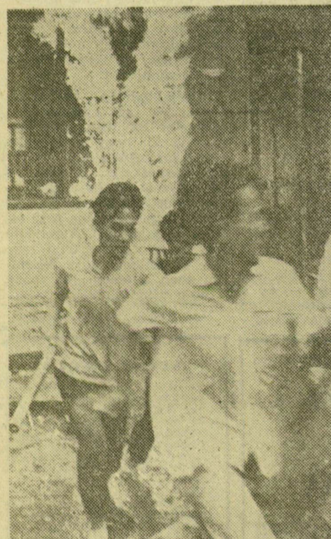
Washingtonban a „szabadság megvédelmezéséről” beszélnek. De miféle szabadság az, amelynek „védelmében” gúnyogatnak a bérgyilkosok: „MADE in USA” mintájú „szabadság” jegyében.