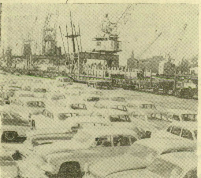
Az NDK többek között személygépkocsikat és motorkerékpárokat is exportál külföldre. Képünkön a Finnországba szállítandó Wartburg típusú személygépkocsik Rostockban rakodásra várnak.