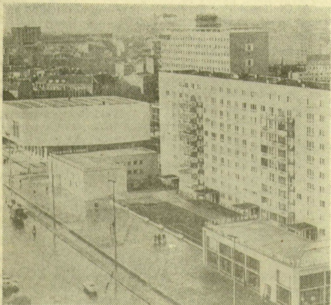
Az NDK városainak évről évre változik az arculatuk. Tervszerűen épülnek az új lakóházak, lakótelepek és az ipari üzemek. Képünkön: új lakónegyed Berlinben.

O któber 7-én lesz 15 éve, hogy Berlinben a Német Népi Tanács — a bonni különállam alapítására való felelősként — a Német Demokratikus Köztársaság Átmeneti Népi Kamarájává alakult. Életbe léptette a 3. Népkongresszus által meghatározott demokratikus német köztársaság alkotmányát, és megbízta Otto Grotewohlt a kormány alakításával. Németország keleti részében megvalósult az, amiért Karl Marx és Friedrich Engels az 1848-49-es polgári demokratikus forradalomban küzdöttek, amiért August Bebel harcolt, amiért Karl Liebknecht, Rosa Luxemburg, Ernst Thälmann és velük együtt a dolgozó nép legjobb fiatal tizedzei életüket áldozták. Viszonylag rövid idő alatt kirajzolódott Németország egyik részében a nemzet jövőjének útja Európá szívében. Béke és szocializmus hazára találtak a Német Demokratikus Köztársaságban.