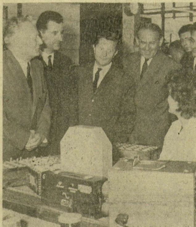
Novotny elvtárs a Beloianisz-gyárban

bizottság titkára nyitotta meg, majd Kádár János, az MSZMP Központi Bizottságának első titkára, a forradalmi munkás-paraszt kormány elnöke lépett a mikrofonhoz.