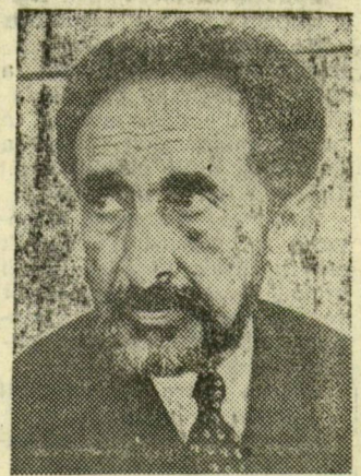
népek tömörítésének. 1963 májusában Addisz Abebában tartották meg az afrikai államfők értekezletét, amely kulcsfontosságú volt az afrikai egységsszervezet megalakulásában.

Etiópia uralkodója az utóbbi években tevékeny szerepet tölt be a nemzetközi és az afrikai politikában, kezdeményezője az afrikai