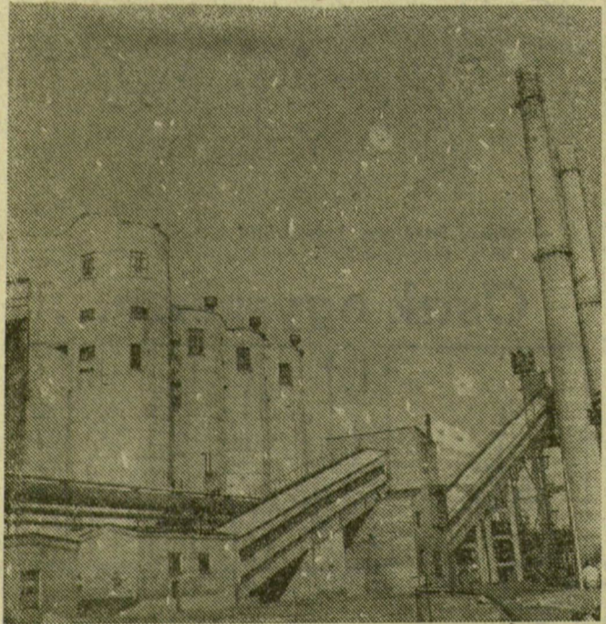
A bolgár és szovjet szénert ebben a négy hatalmas szerkezetben osztályozzák

Szofia környékén mind-össze öt esztendővel ezelőtt jelölték ki a Kermikovci elnevezésű nehézipari kombinát helyét. Ma már szinte készen áll a hatalmas komplexum. Két óriás kohója közül az egyik már termel, sőt még ebben az évben a második is. Szeptember 9-re, a bolgár nép felszabadulása 20. évfordulójának tiszteletére ezt ajánlották fel az építők. 1967-re ez a kombinát 1 millió tonna hengerelt acélt termel majd. Teljes automatizálására törekednek úgyanyira, hogy amikor teljes üzemmél termel majd a vas, akkor is mindössze tízezer munkásra lesz itt szükség.