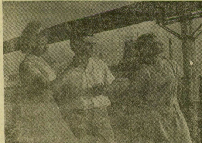
Ők már az új nemzedék. Velük fejlődik hatalmassá a bolgár nehézipar