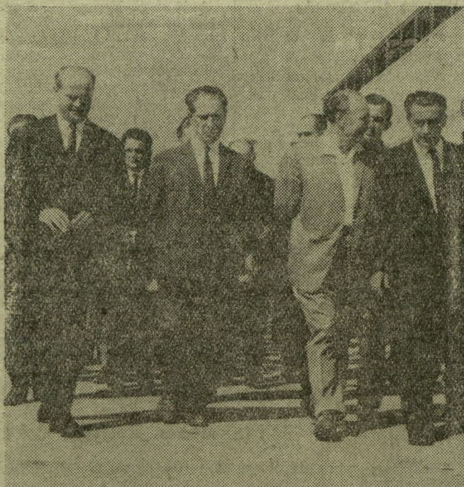
A párt és a kormány vezetőit a kiállításon. Középen Kádár János elvtárs, mellette balról jobbra: Losonczi Pál és Fock Jenő elvtársak

A kiállítás — mondotta befejezésül — akkor éri el a célját, ha az iparban és kereskedelemben dolgozó látogatók megismerik, hogy milyen nagy fontosságú a munkájuk a mezőgazdasági termelés fejlesztésében, a mezőgazdasági dolgozók széles rétege pedig tanulmányozza és felhasználja a ma-