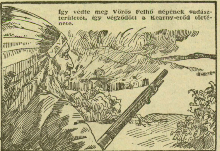
Az út kanyarából visszaneztek a katonák. Vágató pontokat láttak az erdőhöz közeledni, aztán kipirosodott az ég. Lángba borult az erdő.