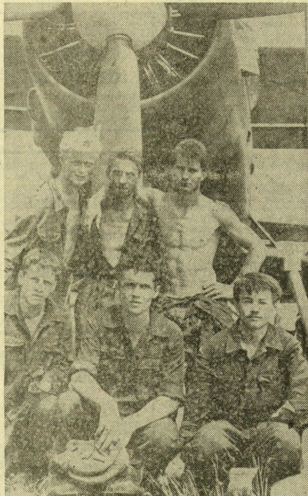
Ismét együtt, a jól sikerült célugrás után

talos a szegedi Felszabadulás Ktsz-ben — figyelni az ugrókat, mint ereszkednek lefelé. S amikor a gyakorlat befejeződik, készül a jelentés: a Magyar Honvédelmi Sportszövetség Csongrád megyei repülőklubjának ejtőernyős szakosztálya sikerrel hajtotta végre kétnapos ugrógyakorlatát.