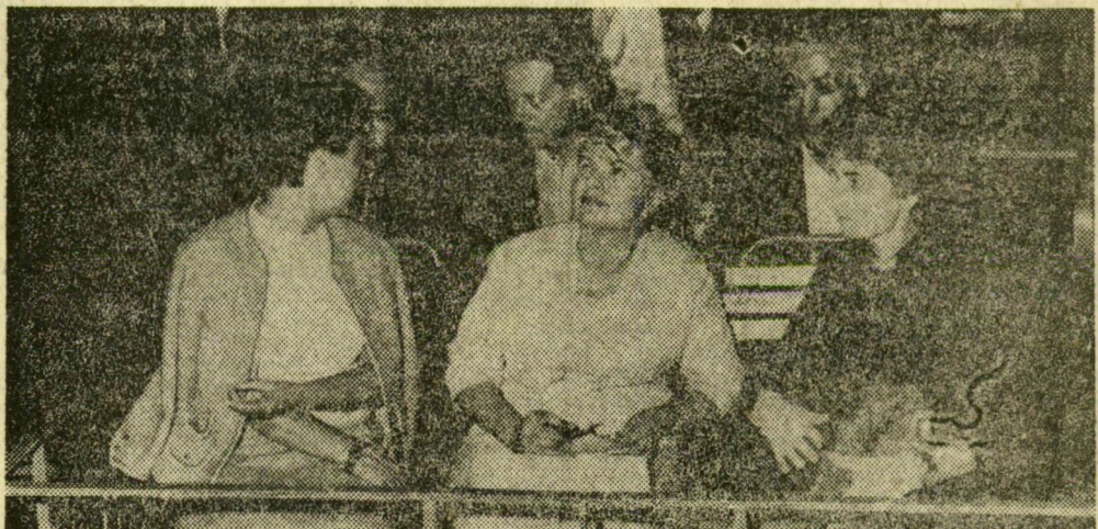
Az ogyesszai pártdelegáció a szabadtéri játékok nézőterén, a megnyitó előadás előtt