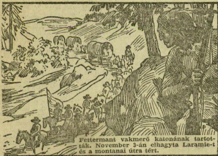
Fettermant vakmerő katonának tartották. November 3-án elhagyta Laramiet és a montanai útra tért.

Írta: Kuczka Péter 2. Rajzolta: Csanádi András