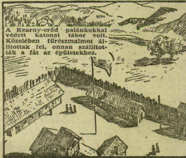
A Kearny-erőd palánkokkal védett katonai tábor volt. Középen fűrészmalmot állítottak fel, onnan szállították a fát az épületekhez.