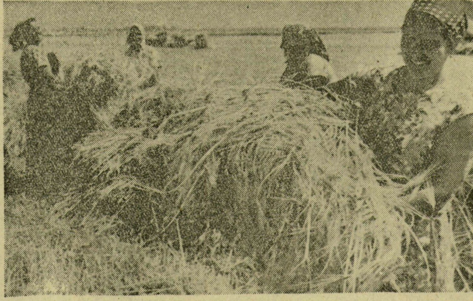
Serény munka folyik a kiskundorozsmai földeken is