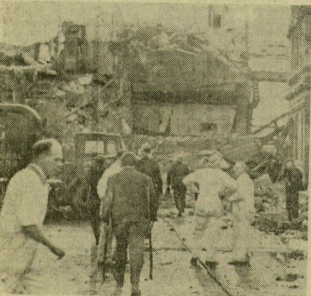
A skóciai Paisleyben néhány nappal ezelőtt eddig ismeretlen okokból felrobbant egy gyár. A robbanás következtében négyen életüket veszítették, négyen megebesültek, egy ember pedig eltűnt.