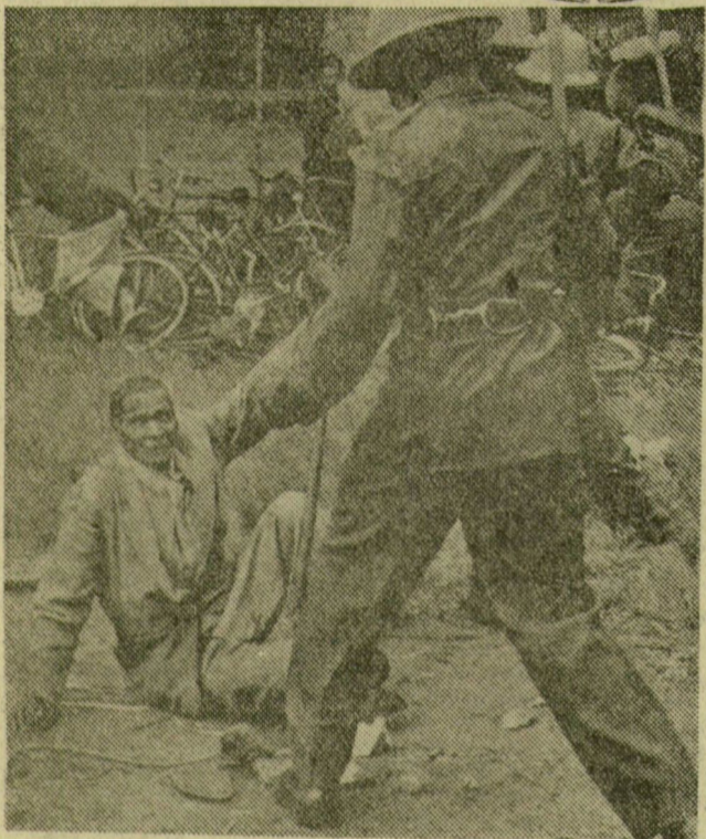
Pillanatkép a Dél-afrikai Köztársaságból. Az ENSZ Biztonsági Tanácsa már kétszer hozott határozatot a dél-afrikai fajüldözés beszüntetésére, s az első eredmény: a Verwoerd-kormány pénteken nem merete halálra ítélni Mandelát és társait.