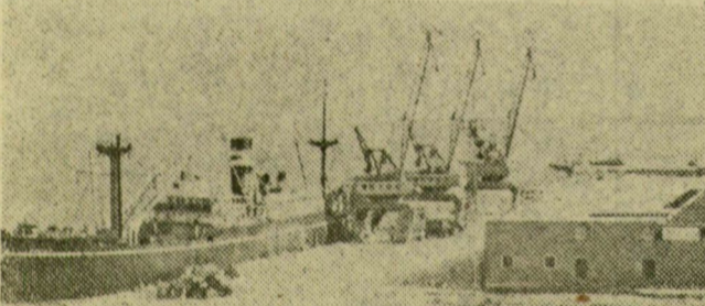
A Jemeni Arab Köztársaság egyik új létesítménye, Hodeida tengeri kikötője. A kikötő 1961 óta fogadja a hajókat, s most szovjet szakértők segítenek jemeni kollégáknak a kikötői munkák megszervezésében.